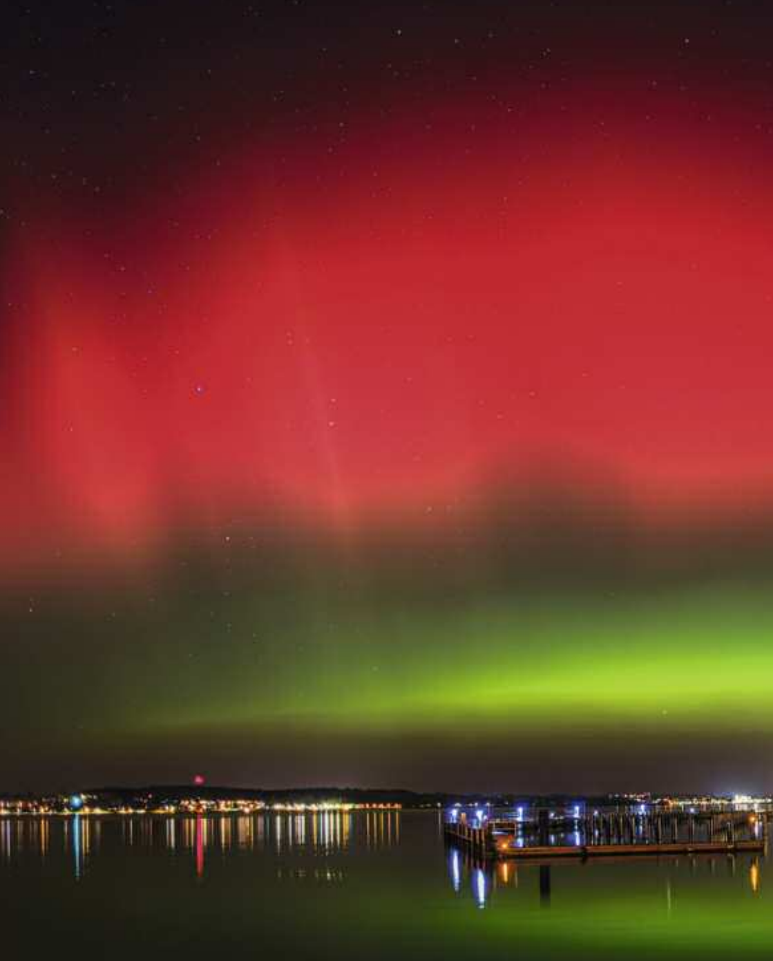
Polarlicht über der WVM