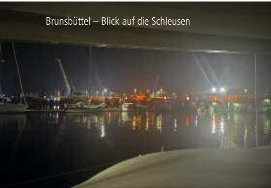
Brunsbüttel – Blick auf die Schleusen

Das Segeln auf der Elbe ist bei Wind mit Tide fast so schön wie auf der Förde.... kaum Welle! Nach einer sportlichen Elbaufwärts Fahrt von 4 Stunden machten wir in Wedel fest.