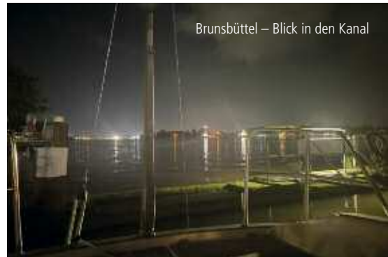
Brunsbüttel – Blick in den Kanal